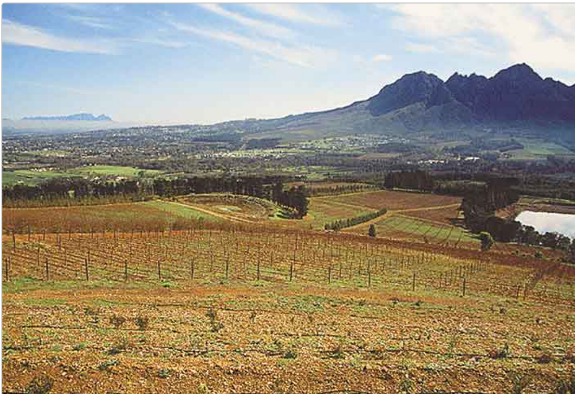
Bild 4: Landwirtschaftliche Anbauflächen – vor allem für Wein und Obst – in Südafrika, zirka 30 Kilometer östlich von Cape Town

(2) wie derartige Einträge in die kleinen Fließgewässer für die Umwelt und für die dort etablierten Lebensgemeinschaften zu bewerten sind, also ob und – wenn ja –, welche Auswirkungen sie auf einzelne Arten und letztendlich ganze Lebensgemeinschaften haben und