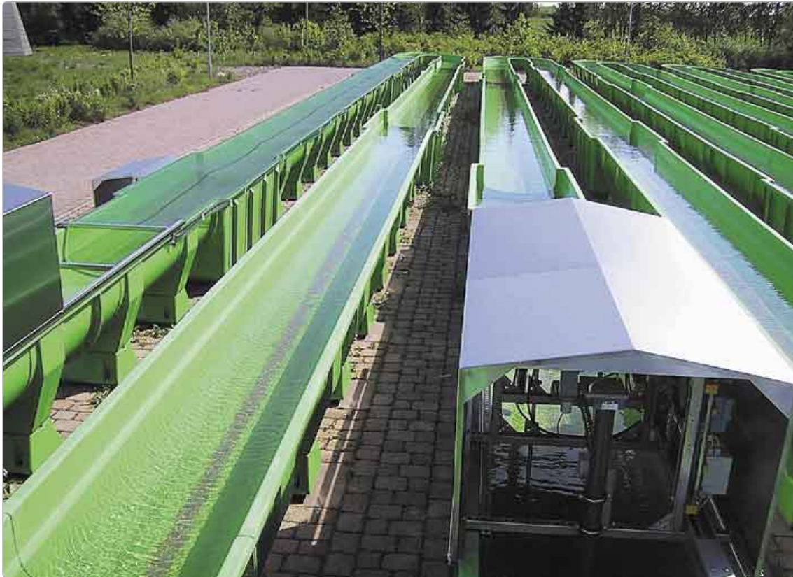
Bild 7: Versuchsanlage des Umweltbundesamtes in Berlin. Mithilfe künstlicher Fließgewässer soll die Wirkung von Schadstoffen erfasst werden.

den unterschiedlichsten Methoden: Sorptions- und Abbauprozesse werden in vielen Fällen durch mathematische Simulationsprogramme berechnet. Die Mischungstoxizität kann in Standardtestsystemen bewertet werden. Die Kombinationswirkung von natürlichen Stressoren und Pestiziden kann in vielen Fällen auch in einfachen Testsystemen – zum Beispiel in so genannten Testbatterien – untersucht werden (Bild 6). Für komplexe Gemeinschaften sind extrem aufwändige Systeme oder Anlagen, die der Natur nachempfunden sind, notwendig. Weltweit eine der größten Anlagen dafür wurde kürzlich am Umweltbundesamt in Berlin mit 16 Gerinnen von 100 Metern Länge in Betrieb genommen (Bild 7). Bei der Planung von Versuchen für diese künstlichen Fließgewässer arbeitet das UFZ mit dem Umweltbundesamt zusammen.