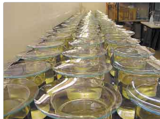
Bild 6: Testbatterien zur Toxizitätsprüfung von Pestiziden im Labor

Die hier aufgeführten ökosystemrelevanten Faktoren verändern die Wirkung eines toxischen Stoffes in der Landschaft – im Gegensatz zum Laborversuch, der diese Faktoren unberücksichtigt lässt – um Größenordnungen. Somit ist eine sinnvolle Risikobewertung ohne die Berücksichtigung dieser Faktoren nicht möglich. Praktisch erfolgt die Einbeziehung der Umweltfaktoren mit