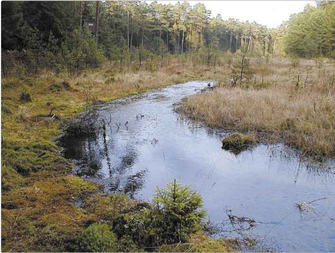
Bild 1: Bach in der Lüneburger Heide