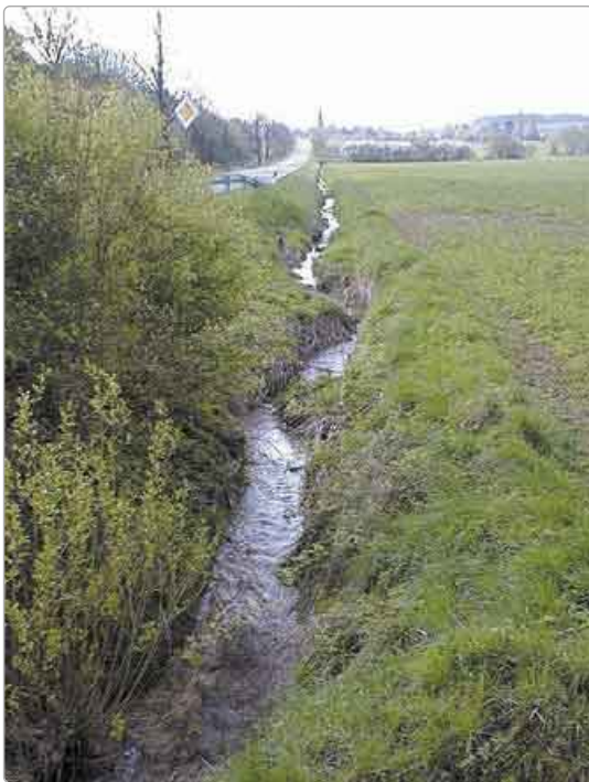
Bild 2: Bach in der Agrarlandschaft des Weser-Berglandes

Vor allem im Frühjahr, wenn noch wenig Boden bedeckende Pflanzen auf den Äckern gewachsen sind, ist bei starken Regenfällen selbst bei geringer Hangneigung des Umlandes mit diffusen Stoffeinträgen zu rechnen (Bild 3).