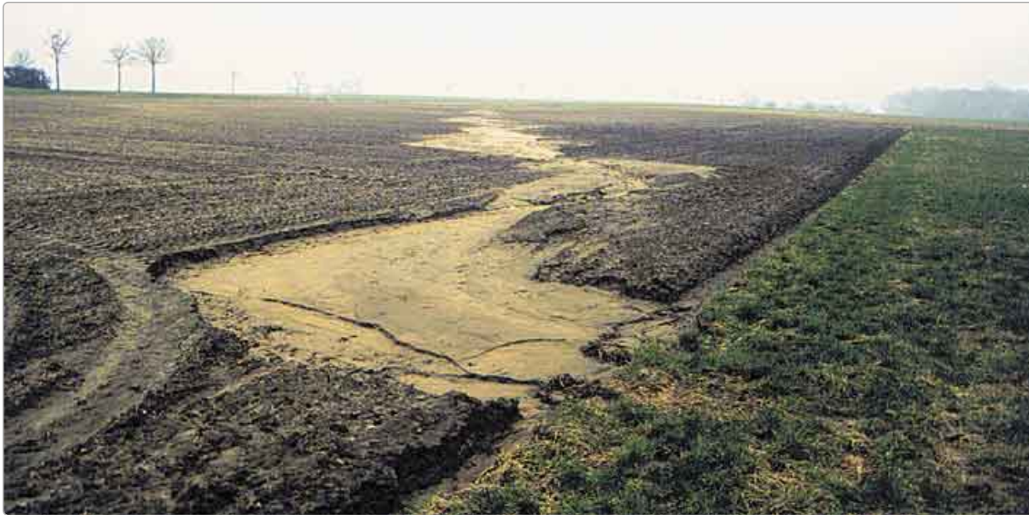
Bild 3: Acker mit Erosionsrinne in der Magdeburger Börde